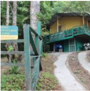
Áreas turísticas de la altiva provincia.