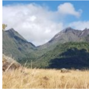
Áreas turísticas de la altiva provincia.