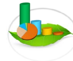
Gráfica 3-1.a. SOLICITUDES PARA USO DE AGUA APROBADAS EN MIAMBIENTE, POR CUENCA: AÑOS 2014-2015