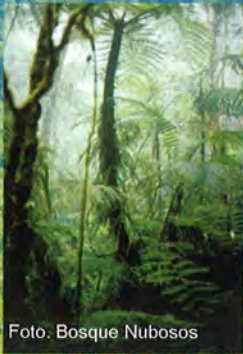
Foto. Bosque Nubosos

El Sitio de Patrimonio Mundial Natural (SPMN) Transfronterizo: Reservas de la Cordillera de Talamanca - La Amistad/Parque Nacional la Amistad, cubre 570045 has y está conformado por un área protegida binacional (Costa Rica—Panamá): el Parque Internacional La Amistad y seis áreas protegidas costarricenses: Parque Nacional Chirripó, Parque Nacional Tapantí-Macizo de la Muerte, Parque Nacional Barbilla, Reserva Biológica Hitoy Cerere, Reserva Forestal Río Macho y Zona Protectora Las Tablas.